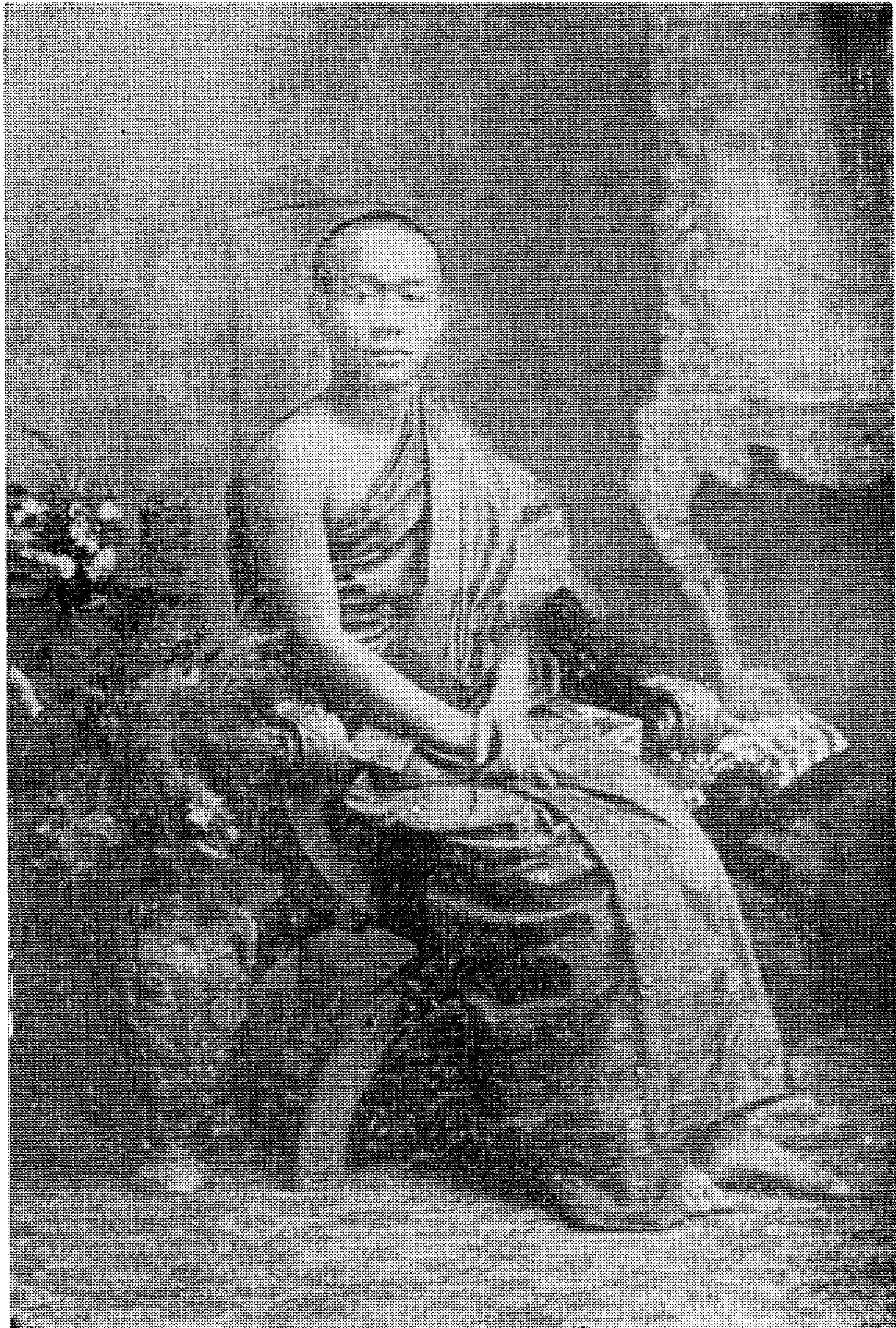
ပရမတ္ထသံခိပ်ဋီကာ အပါအဝင် လောကီ,လောကုတ္တရာ ကျမ်းပေါင်းများစွာတို့ကို ပြုစုခဲ့သော လယ်တီပဏ္ဍိတ အရှင်မြတ်ပုံ